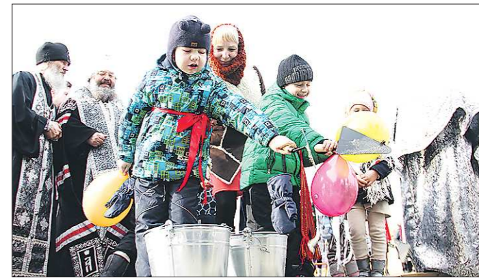
Воспитанники поселковой школы-детсада с удовольствием приняли участие в церемонии. Им было позволено бросить в символическую нишу по совочку цементного раствора