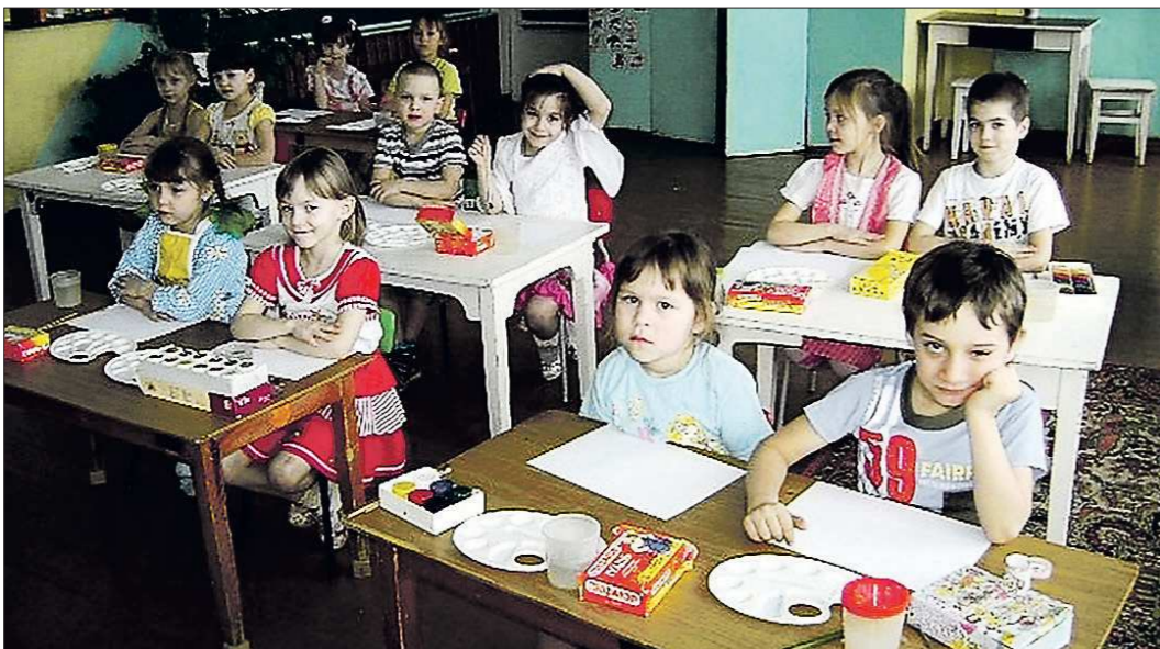
Хорошо ли по 12 часов проводить в детском саду? Мнения среди воспитанников качканарского детского сада «Ладушки», очевидно, разделились

В этом году в качканарских детсадах прошли значительные реформы. График работы дошкольных учреждений по просьбе родителей увеличен до 12 часов. Также впервые за последние четыре года выросла родительская плата, при этом был сокращён перечень льготников. Некоторые семьи получили счета, второе превышающее прошлогодние. Но даже при этом соседние муниципалитеты поглядывают на качканарский эксперимент с лёгкой завистью.