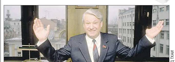
Борис Ельцин в феврале 1989 года

25 лет назад (в 1989 году) на выборах народных депутатов СССР по национально-территориальному избирательному округу №1 (город Москва), наш земляк Борис Ельцин получил такой перевес голосов избирателей, который Книга рекордов Гиннесса зафиксировала как высшее мировое достижение. За Ельцина проголосовало на 4 726 112 человек больше, чем за его соперника (89,44 процента избирателей). Выборы 26 марта 1989 года вошли в историю как первые свободные выборы в СССР. Правовая база для проведения этих выборов была заложена на XIX всесоюзной партконференции, на которой была принята резолюция «О демократизации советского общества и реформе политической системы», которой учреждался новый высший орган законодательной власти страны — Съезд народных депутатов СССР.