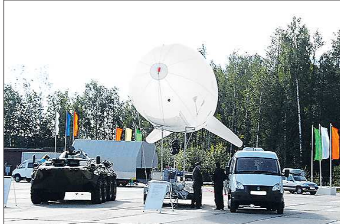
С привязного аэростата «Око» полиция следит за порядком

съемках некогда популярного фильма «Гиперболоид инженера Гарина» (этот эпизод легко отыскать в Интернете). Другая модель «Урал-3» прогремела на весь СССР по иному поводу.