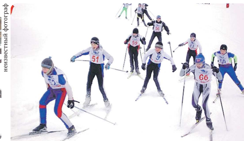
На нижнетагильской лыжной базе «Спутник» ребята с ограничениями по здоровью занимаются в общей группе. На трассе их не отличить от всех остальных