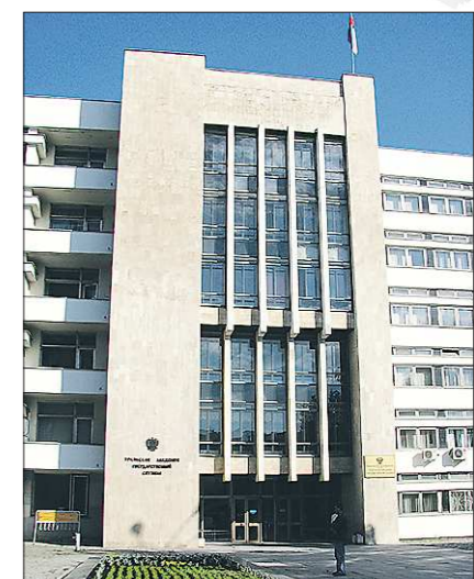
Уральская академия государственной службы находится на улице 8 Марта, 66

В 1932 году Уралбюро ВКП(б) приняло постановление об организации в Свердловске высшего партийного учебного заведения — областного Института марксизма-ленинизма.