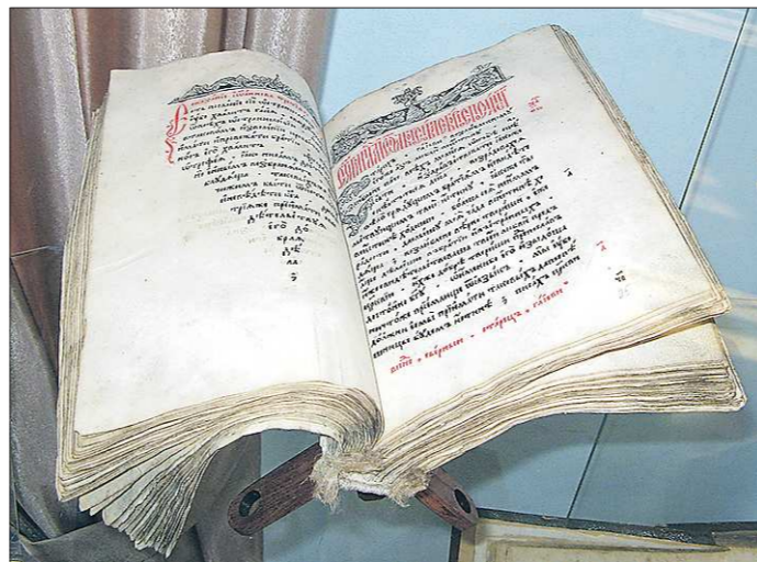
Один из уникальных экземпляров выставки книжных редкостей — «Апостол» ученика Ивана Фёдорова, печатника Андроника Невежи, изданный в 1597 году. Книга была напечатана в московской типографии тиражом в тысячу экземпляров, сохранилось всего 50, и один из них — в Екатеринбурге

те, что стали делать позднее, в XVIII–XIX веках. Тиражи стали больше, а внимание к качеству книг — меньше. Мне сообщают, что каждую неделю всё время выставки (а она продлится до середины мая) страницы «Апостола» будут перелистывать. Так что посетители смогут лицезреть большую часть этой книги. Листать время от времени старинные фолианты необходимо по технологии хранения — для проветривания. Раритетные издания хранить непросто, ещё сложнее их выставлять. Для этого, кроме надёжной охраны, надо обладать множеством специальных знаний. Иметь в штате достаточное количество профессионалов. На это идут немногие. Так что эта выставка уникальна. Древние отечественные книги выставлены для широкой общественности только в специальной музее в Российской государственной библиотеке в Москве. Прежде были ещё подобный музей в Институте книги во Львове, но в связи с украинскими пе-