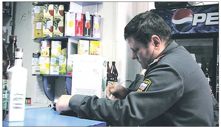
«Антиалкогольный периметр» в Нижнем Тагиле был скорректирован, но работы у проверяющих — полицейских и общественников от этого не убавилось

С введением поправок часть торговых заведений вернула себе право на торговлю спиртным, но для большинства магазинов запрет остался в силе. Сотрудники полиции и общественники по-прежнему ревностно следят за выполнением резонансного постановления. Так, буквально вчера выявлен очередной факт незаконной продажи крепкого алкоголя и пива в магазине, находящемся по соседству с детской школой искусств. В ходе операции изъято почти 600 литров алкогольной продукции.