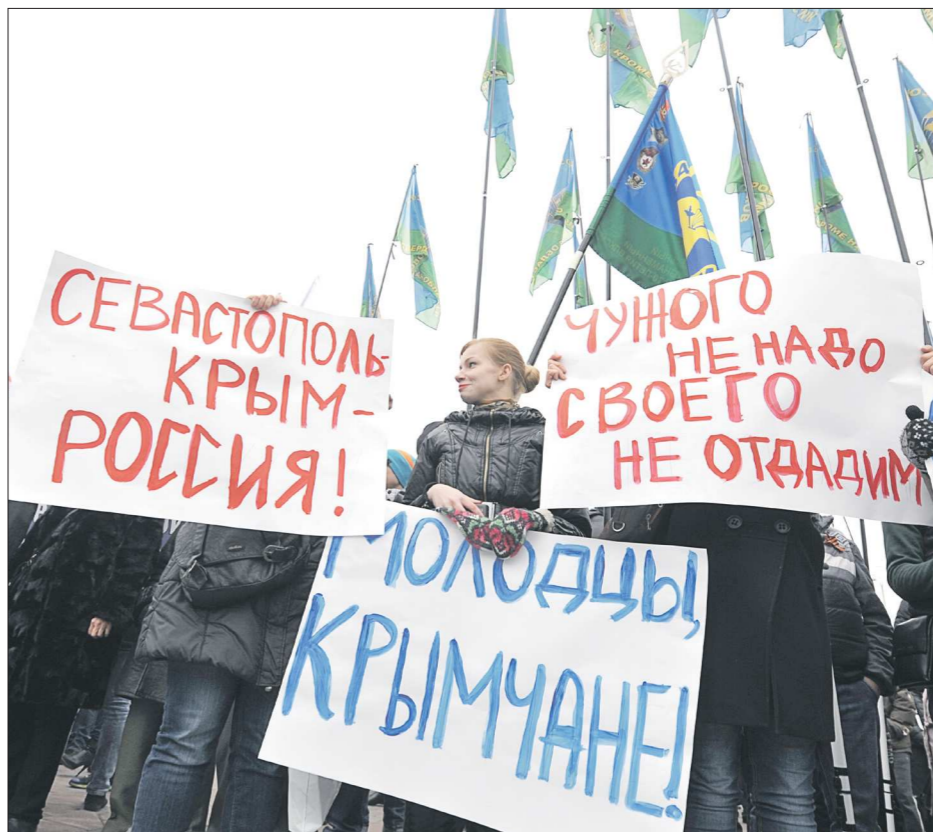
Практически одновременно с подписанием договора прошёл митинг на площади Труда в Екатеринбурге. Около пяти тысяч человек вышли поддержать решение Президента. Отныне Свердловская область и Крым – равноправные субъекты Российской Федерации