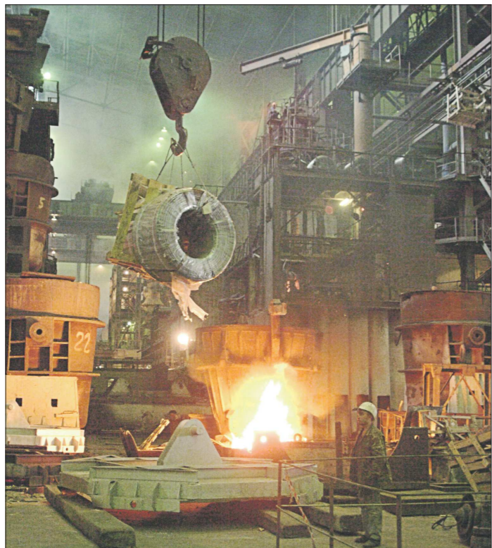
От удешевления рубля продукция наших металлургов станет более конкурентной