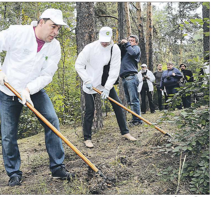
Свердловчанам Евгений Куйвашев уже запомнился не только как чиновник, но и как обычный человек, который запросто может пройтись по улицам без охраны или взять в руки грабли...