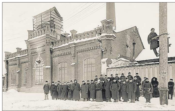
На фоне электростанции. Здесь хорошо виден фасад, который сохранился почти неизменным