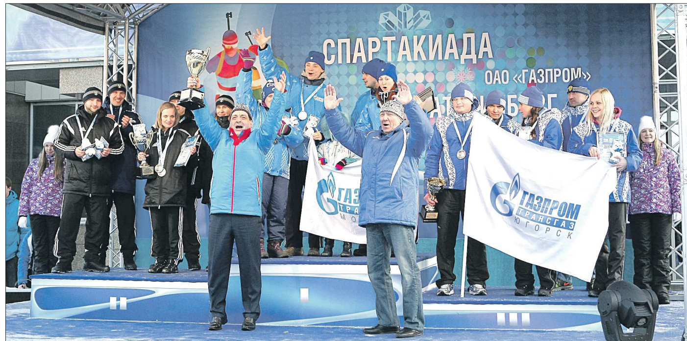
На спортивных площадках царил олимпийский дух

Десятая взрослая и пятая детская зимние Спартакиады стали историей. На протяжении недели на восьми спортивных объектах Екатеринбурга атлеты из 22 дочерних обществ компании разыгрывали более ста комплектов наград. Взрослые участники Спартакиады выявляли сильнейших в лыжных гонках, биатлоне, мини-футболе, настольном теннисе, пулевой стрельбе. Дети соревновались в лыжных гонках, хоккее с шайбой, настольном теннисе и мини-футболе.