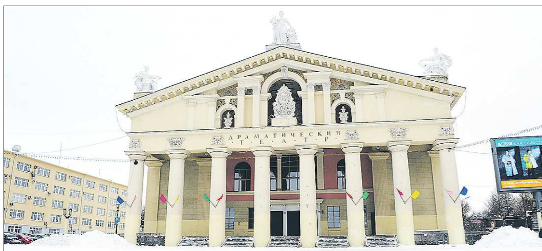
Нижнетагильский драмтеатр — один из тех, кого ждёт реконструкция в Год культуры