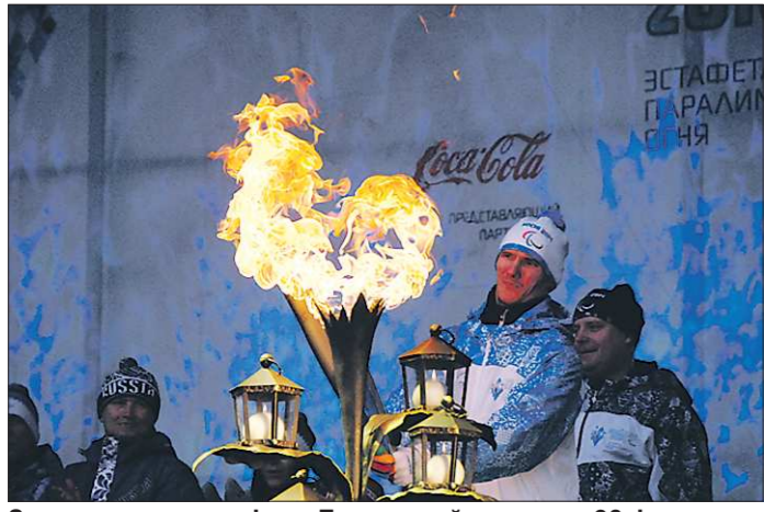
Один из этапов эстафеты Паралимпийского огня 28 февраля прошёл через Екатеринбург