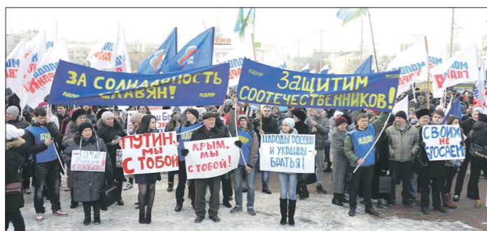
Кроме резолюции, на площади Труда зачитывали тексты плакатов, и участники митинга встречали это одобрительным «да!»

События в соседней стране настолько заделали за живое, что собрали вместе студентов и ветеранов, рабочих и преподавателей, профсоюзных активистов и казаков. Даже политические оппоненты, не-