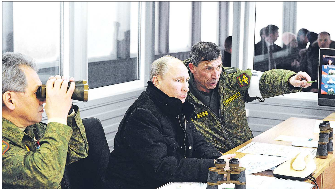
За одним из ключевых эпизодов внезапной проверки боеготовности войск Западного военного округа на полигоне Кирилловское наблюдали Верховный главнокомандующий Вооружёнными силами Владимир Путин (в центре) и министр обороны РФ генерал армии Сергей Шойгу (слева)