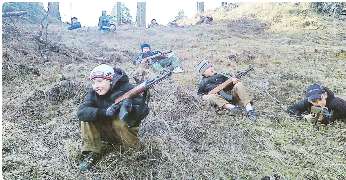
Занятия по военной тактике у воспитанников клуба «Морской пехотинец» проходят в окрестностях города

23 февраля в военно-патриотических клубах традиционно отмечают игру «Зарница»