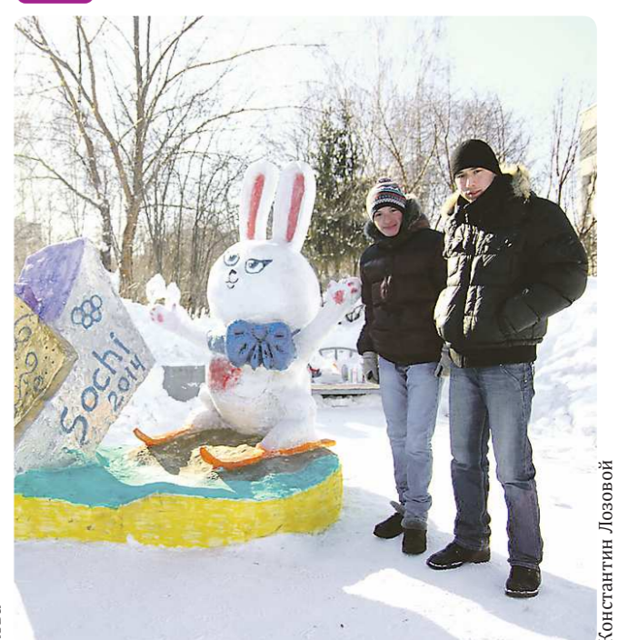
Студенты Уральского государственного университета путей сообщения провели конкурс снежных скульптур, посвящённых Олимпиаде в Сочи. Восемь команд, вооружившись лопатами, скребками и баллончиками с краской, возродили из снега олимпийские символы – Мишку, Зайца, Леопарда, а также хоккейного вратаря, матрёшку, факел и другие. Для каждой команды был подготовлен снежный куб объёмом полтора кубометра. Жюри оценивало красоту фигур, оригинальность и качество исполнения. Одной из лучших фигур признали олимпийского Зайца в исполнении студентов механического факультета.

У «Новой эры» есть своя группа на сайте «ВКонтакте»