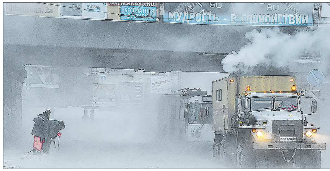
Поврежденный в Екатеринбурге водопровод диаметром 150-200 мм сейчас отключён. В устранении последствий утечки были задействованы пять аварийных бригад, шесть экскаваторов, три самосвала и насос на базе трактора «Беларусь»