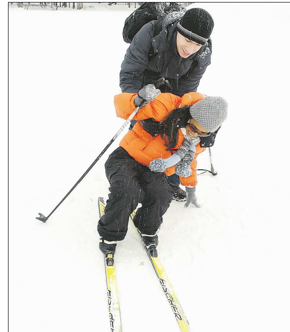
А вот впервые встать на лыжи — это очень страшно!

зато стала гвоздём программы концерта «Рождественский дивертисмент», который состоялся в рамках игр «Европа-Азия» во Дворце молодёжи.