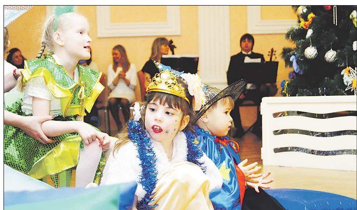
Многие из этих ребятшек впервые попали на детский праздник