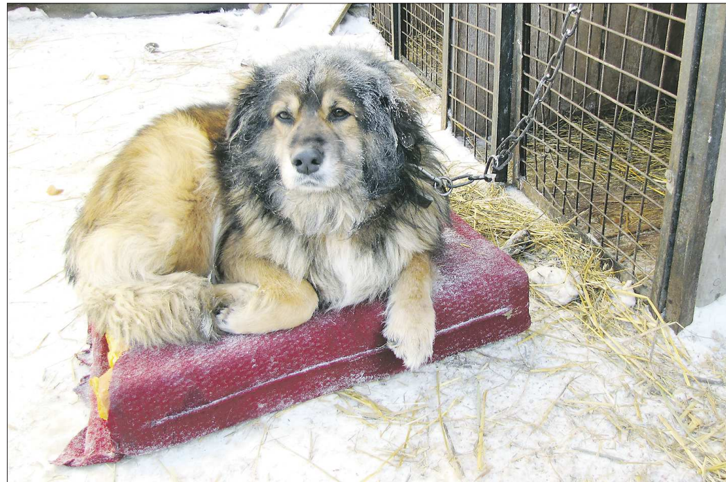
Все знаем: «Только от жизни собачьей собака бывает кусачей». Знаем и продолжаем бороться с собаками. Лишь некоторые уверены: надо воспитывать людей, а собакам создавать условия

Фая и Орион попали на этот огороженный деревянным забором участок спецбазы № 4 в Екатеринбурге с улицы. Специалисты отловили — привезли. Но, случается, хозяева приводят сами. Иногда не от хорошей жизни. Пуделька отдала бабушка: дед тяжело заболел, ни сил, ни времени на собаку не осталось. Людей понять можно. Только вот животное, неделю отказываясь от пищи, умерло, в конце концов, от голода и тоски. И реанимация не спасла. А перед выходными какой-то мужик привёл Семю. Сказал — нашёл. Потом выяснилось: добрый, ласковый пёсик не годится в охранники, а друг, компаньон ему оказался не нужен.