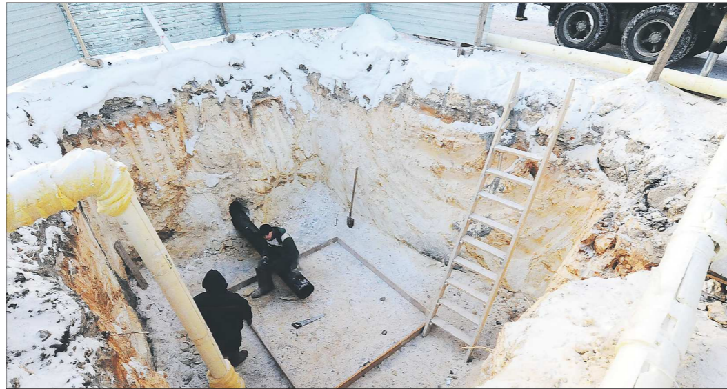
Более ста семей ждут, когда рабочие подключат воду к дому на улице Баумана

А в дом № 45 по улице Барвинка многие семьи уже заселились – устали ждать, когда новостройку официально вве-