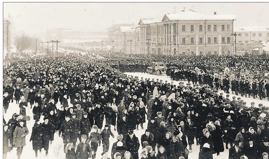
10 декабря 1950 года. Провожать в последний путь любимого писателя вышел весь Свердловск

Уже в начале сороковых Бажов был издан на трёх континентах — в Европе, в Австралии, в Америке. Всего его был переведён на 68 языков. А теперь вспомните-ка сами тексты — это ведь непереводадим!