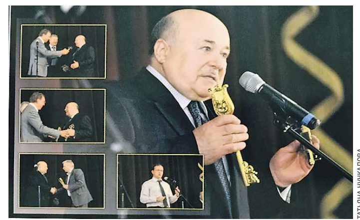
Председатель СТД России Александр Калягин открывает Дом ветеранов сцены в Санкт-Петербурге