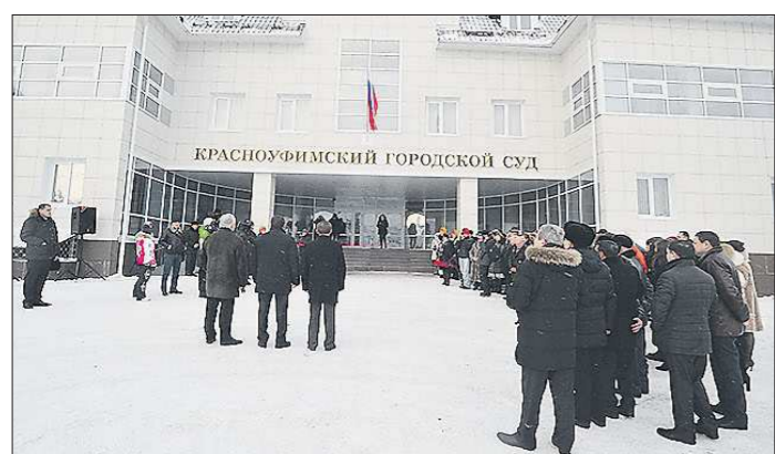
Новое здание суда по площади почти в три раза больше старого