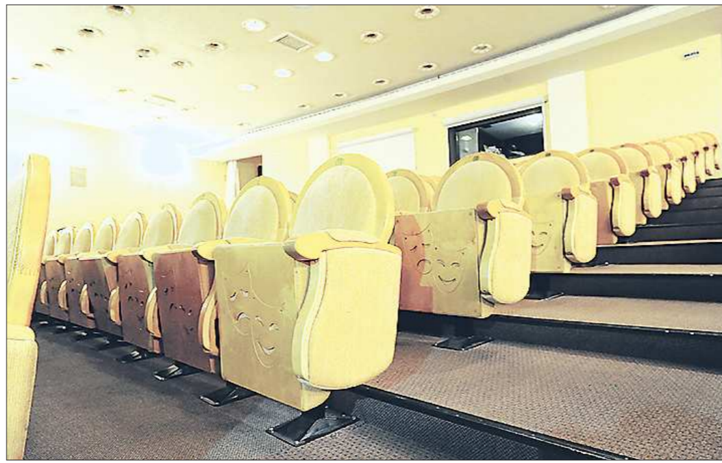
Благодаря средствам, выделенным из областного бюджета в преддверии Года культуры, Театр драмы позаботился и об актёрах, и о зрителях. Первым достались отремонтированные гримёрки со всеми удобствами, вторым — новые уютные кресла