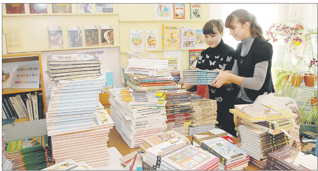
К 2015 году школы полностью перейдут на новые учебники по истории. А старые, в том числе и недавно изданные – в макулатуру?

Качество ввозного алкоголя контролировать сложнее, куда проще, если завод – вот он, под боком. Но у нас таких почти не осталось: процент собственной спиртосодержащей продукции в Свердлов-