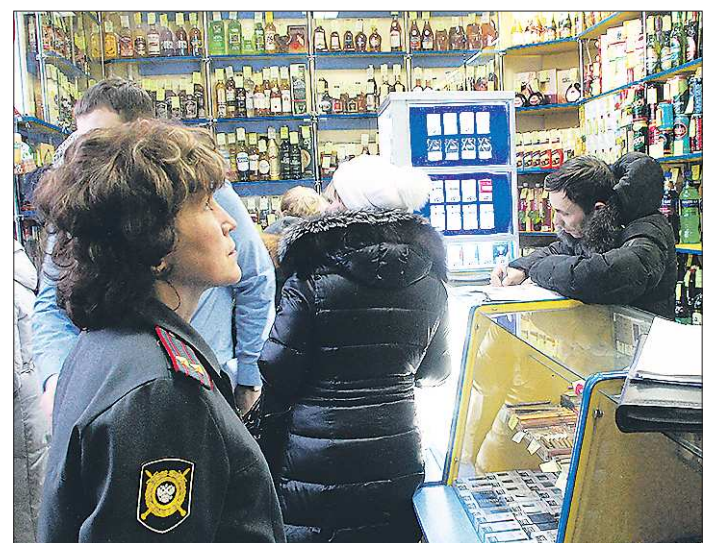
По итогам проверки торгового павильона на улице Зари в Нижнем Тагиле на ответвление принято более двух тонн алкогольной продукции