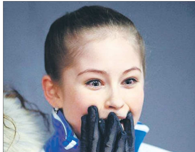
Юлия Липницкая только что увидела результаты и ещё несколько раз переспросила: «Это окончательный итог? Я чемпионка Европы? И я еду на Олимпиаду?»

Я уже много раз видела её произвольную программу, и знала, какие прыжки в какой последовательности она выполняет. И когда вместо сложнейшего каскада из трёх прыжков фигуристка вдруг прыгает один, я заволновалась. В интервью после проката тренер Юли, Этери Тутберидзе, призналась, что в тот момент она думала только об одном — где самый