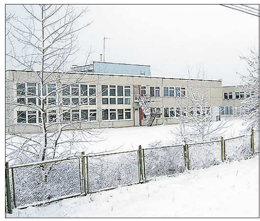
В сельской школе самой южной Сухановки — 83 ученика. В 10 классе учатся только четверо — все мальчики, а во 2 классе — одна-единственная ученица