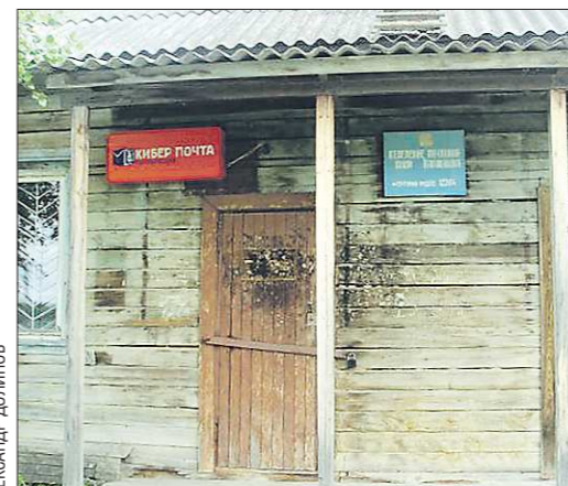
«Кибер-почта» в самом восточном населённом пункте Свердловской области — посёлке Карабашка Тавдинского городского округа