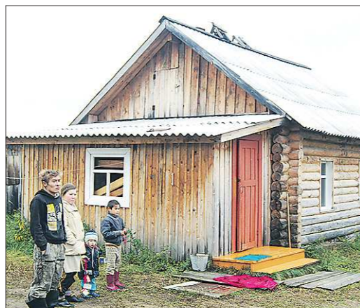
В самом северном населённом пункте области — посёлке Ушма — сегодня проживает всего 41 человек. Все — манси