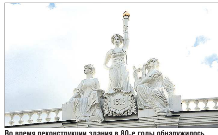
Во время реконструкции здания в 80-е годы обнаружилось, что музы выполнены из бетона. Строители были удивлены: как было возможно отлить из бетона скульптуру с большим количеством мелких деталей в 1912-м?