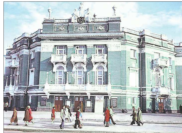
Таким здание было до реконструкции. В преддверии 100-летнего юбилея ему вернули исторический серо-голубой цвет

родского театра, в котором победил Владимир Семёнов (на тот момент — начинающий архитектор, имеющий несколько проектов в Кисловодске и Ессентуках. А в начале 1930-х он станет главным архитектором Москвы). Его проект носил романтическое название «Светлана» и был основан на лучшем мировом опыте, к примеру, на модели Венского театра оперы. В 1910-м строительство началось. Но от изначальной «Светланы», запланированной исключительно в стиле «модерн», архитектурная комиссия, возглавляемая Константином Бабыкиным и Иваном Янковским, оставляет лишь основу. В итоговом проекте они украшают фасад, добавляют декор и скульптуры. В итоге получается неobarочный стиль, наложенный на современную основу.