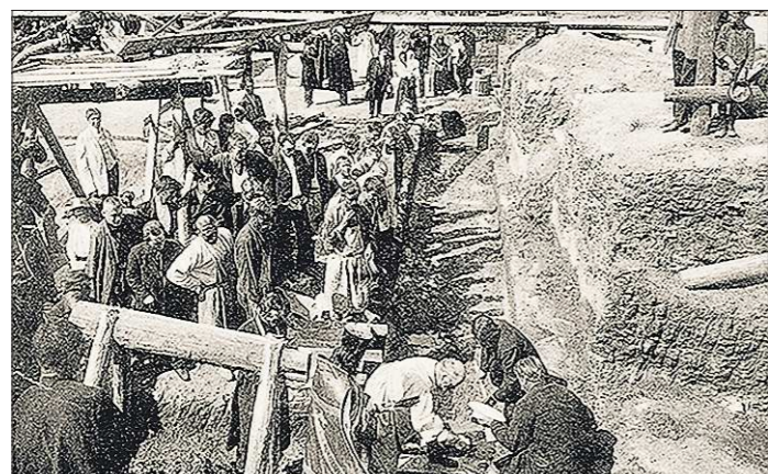
1910 год. Строительство театра на Дровяной площади только начинается... Кстати, простые горожане активно помогали возводить храм искусств