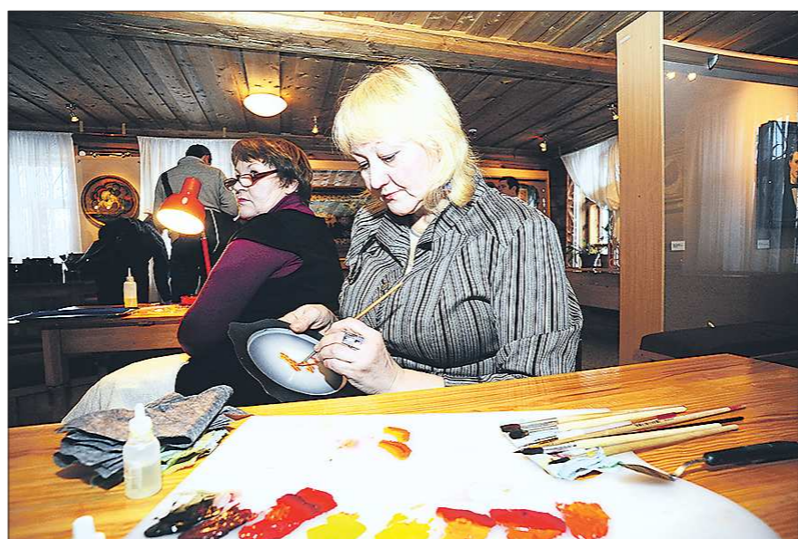
Уральские народные промыслы — то, что делает нашу культуру уникальной. Лаковая роспись по металлу по-прежнему остаётся одним из самых кропотливых видов искусства

единственный в России Музей золота, который расположен в Берёзовском и Музей Эрнста Неизвестного в Екатеринбурге. — А если говорить о последних годах? — Культура очень серьёзно меняется. Она движется в сторону слияния, сочетания всевозможных жанров. Происходит синтез искусств. Вспомните и «Данс-платформу», и фестиваль «На грани», и многое другое. Это отражается и при создании новых музейных экспозиций, где создатели стараются воздействовать на все органы чувств посетителя. В последние годы возрождается интерес к истории области, вспоминаются забытые страницы, открываются новые имена. — Наталья Константиновна, а лично вы за какими событиями культуры особенно следите? — За всеми, но особенно — за литературой. Очень люблю читать. Понятно, что все новинки прочесть невоз-