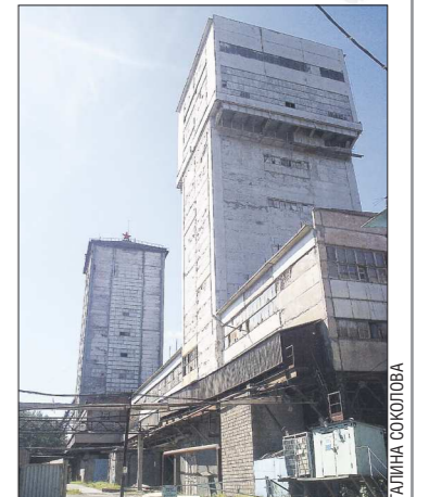
Копры шахт, построенных работниками треста «Востокшахтопроходка»

55 лет назад, в 1959 году, по инициативе Свердловского совнархоза был создан горноуральный трест для строительства в регионе новых шахт и реконструкции действующих. Его дирекция получила «прописку» в Нижнем Тагиле.