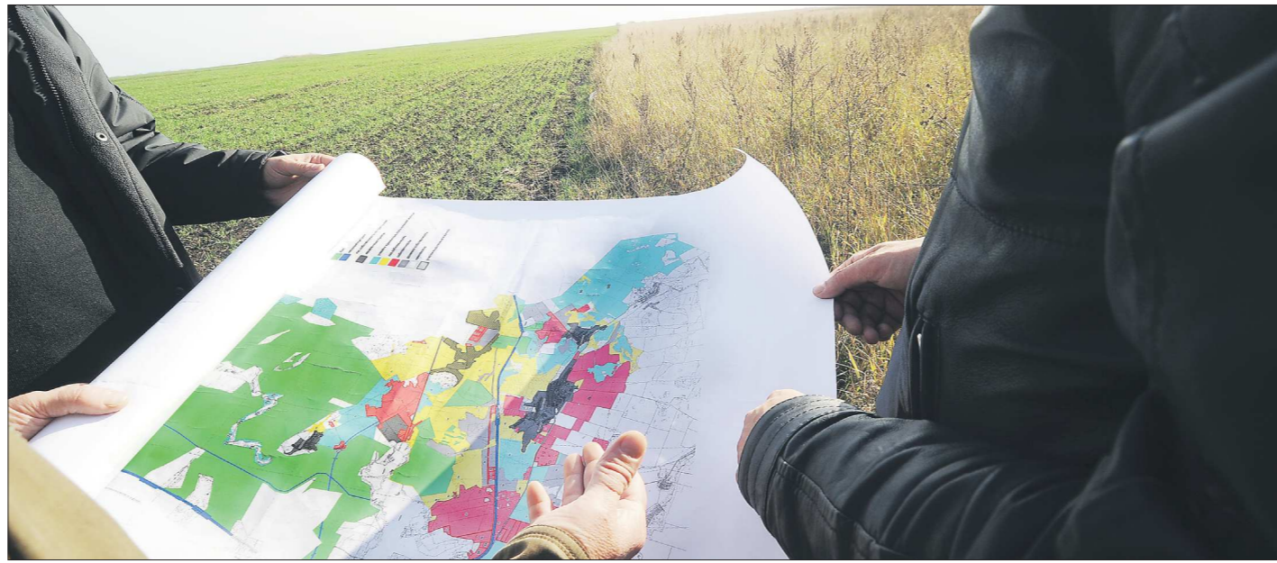
Бросаем пить и курить. Начинаем обрабатывать землю

Министр доложил и о ходе создания единого интернет-портала, обеспечивающего возможность контроля деятельности управляющих компаний и ТСЖ жителями Среднего Урала. По словам министра, это поручение губернатора выполняется «достаточно оперативно».