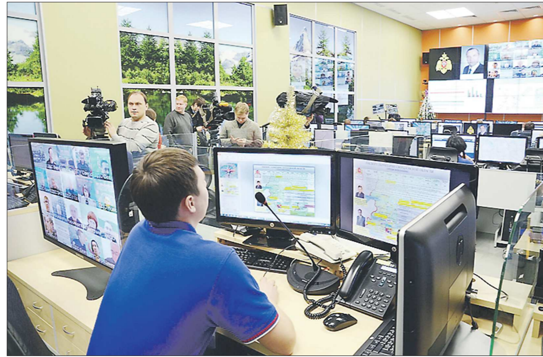
Оперативно-дежурная смена в новом ЦУКСе уже получает в режиме реального времени всю необходимую информацию