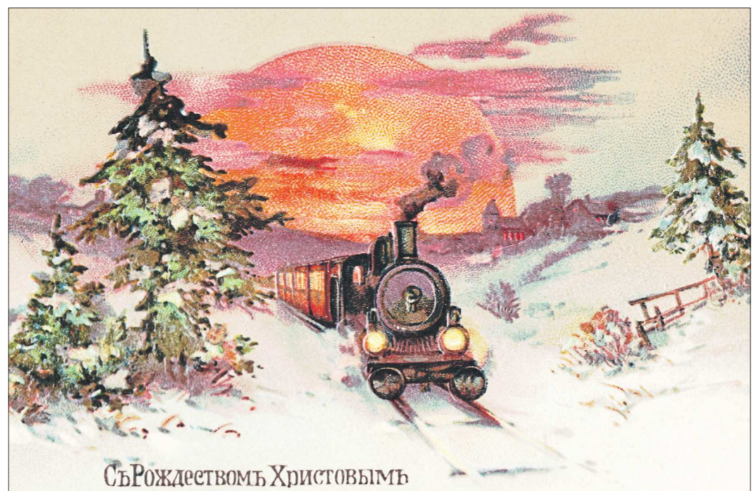
Среди рождественских эта открытка – одна из самых любопытных: всё-таки не часто встретишь поезд на поздравлении с рождением Христа

Специалисты утверждают, что это особенность открыток: только общие хорошие слова и ничего такого, что не должно предназначаться для чужих глаз.