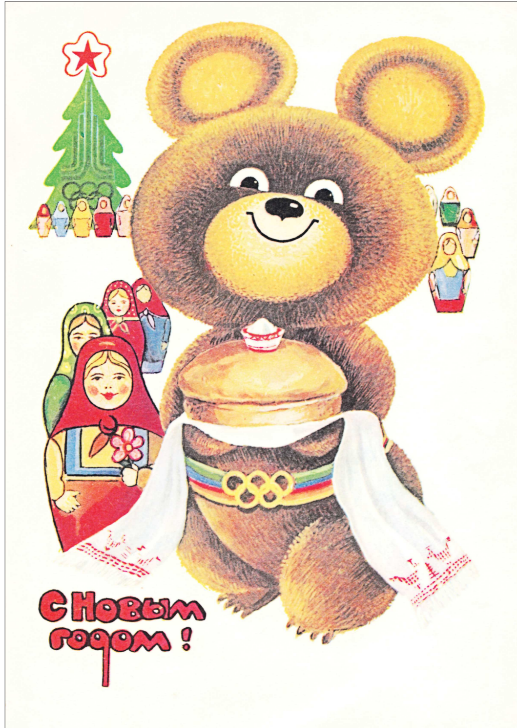
Советская открытка 1979 года. Посвящённая предстоящей Олимпиаде-80, в нынешнем году она вполне актуальна

«ОГ» проследила, как за 120 лет своей истории менялись новогодние и рождественские открытки