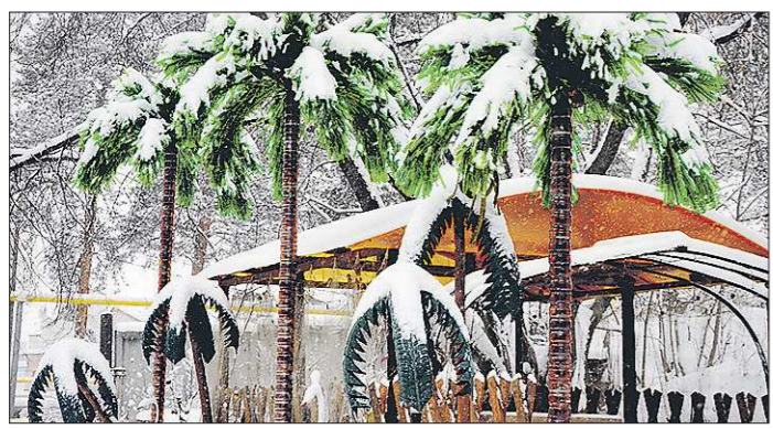
Авторы инсталляции работают вместе – и живут по соседству

Но потом обновили беседку и сделали ещё три больших пальмы да три низкорослых – с листьями из крашеных автопокрышек. К растениям добавились самодельные птицы: лебедь и фламинго. Куба преобразилась и ожила. Совсем недавно на крыше гаража здесь появился дракон. У свободных художников есть новые задумки. «Какие вы молодцы!» – говорят местные жители и гости Большеконного полуострова. – Себе жизнь украшаете и нас радуете. Большое спасибо! Низкий поклон.»