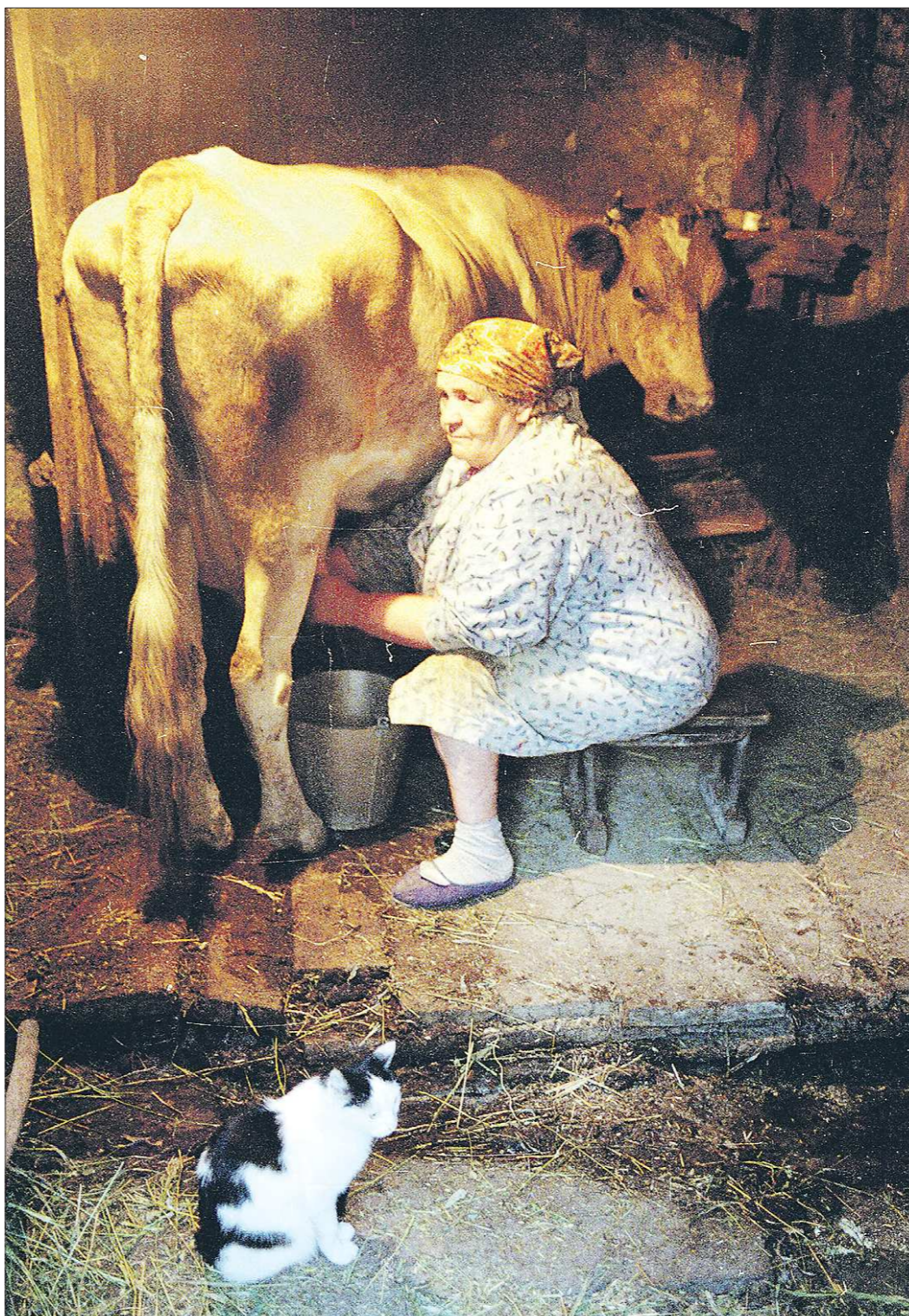
Многие живописцы сейчас стремятся к фотографически точному изображению. Даже жанр такой появился — фотореализм, когда нарисованную картину невозможно отличить от фотоснимка. А вот фотокор «ОГ» Алексей Кунилов пошёл в обратную сторону: его работа выглядит так, как будто она нарисована, а не сфотографирована