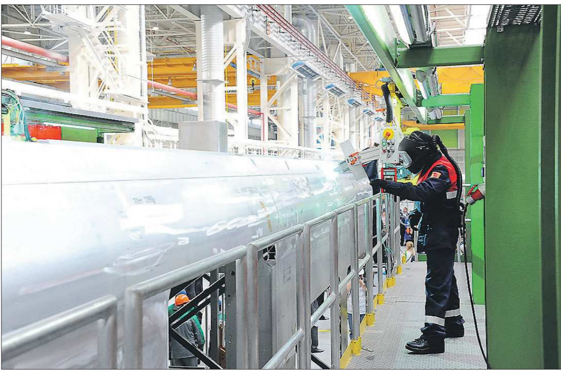
Ответственный момент для работников кузовного цеха завода «Уральские локомотивы» — сварка 25-метрового кузова первого электропоезда нового поколения «Ласточка»

Мощность подстанции 80 мегаватт. Объект обеспечит возможность строительства и ввода в эксплуатацию новых зданий и сооружений на востоке и юго-востоке столицы Урала. Также в декабре была открыта подстанция «Рассоха» в районе посёлка Кошулино, где ведётся интенсивное жилищное строительство. Ещё одно «энергетическое» событие декабря — завершение строительства четвёртого блока БН-800 на Белоярской атомной электростанции.