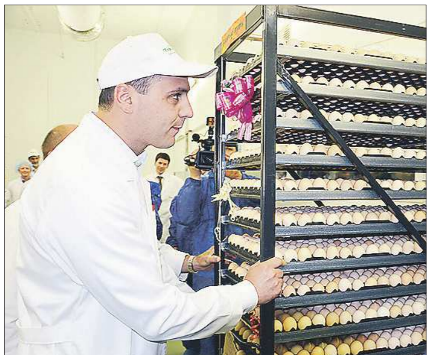
В первой массовой закладке инкубационного яйца в новый инкубаторий птицефабрики «Рефтинская» участвовал региональный премьер-министр Денис Паслер. Через три недели здесь появились 4800 маленьких жёлтых птенцов

На новый «цыплячий роддом» птицефабрика потратила 353 миллиона рублей.