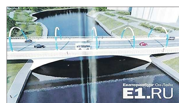
Один из предполагаемых вариантов моста. Окончательный проект ещё не утверждён

управлению государственного имущества Свердловской области.