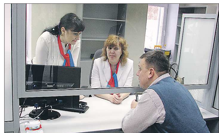
С открытием в Нижней Салде многофункционального центра поредели и очереди к местным паспортным