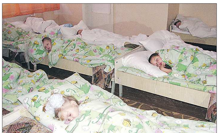
С реконструкцией детского сада очередь за путёвками в Нижней Салде подвинулась на сорок человек. Но осталось ещё около 250

Рыболовы знают: заманить озёрную королеву на крючок можно кусочком креветки или зёрнышком кукурузы