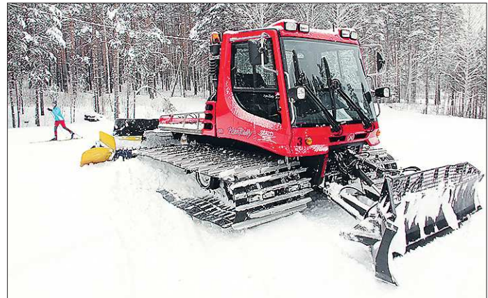
Ратрак трудится в полную силу при снежном покрове толщиной не менее 20 сантиметров