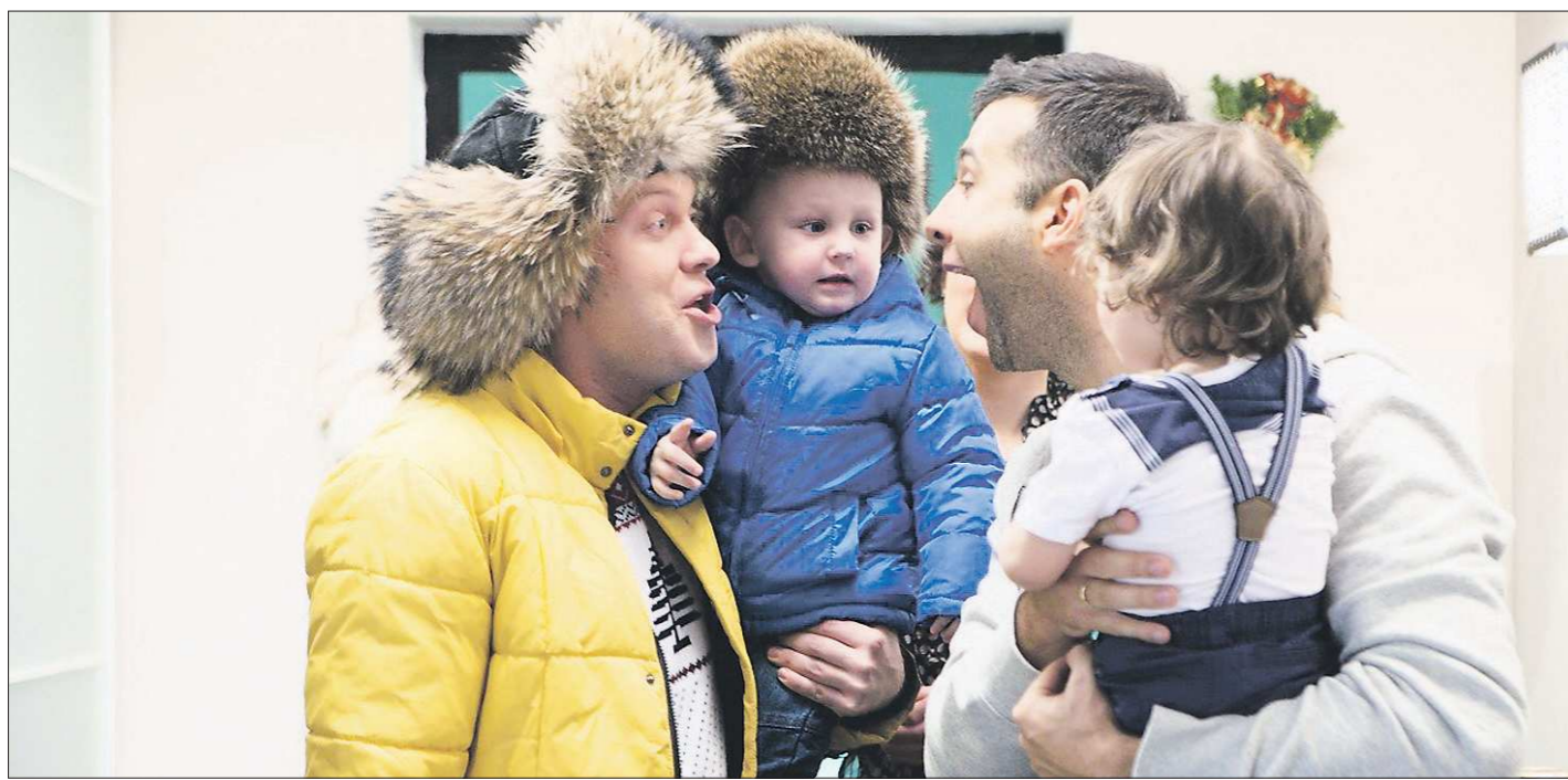
Зарисовка с Иваном Ургантом и Сергеем Светлаковым — яркий, но не отличающийся оригинальностью эпизод. Непутёвые отцы пытаются справиться с детьми — картин на эту тему в мировом кинематографе не счесть