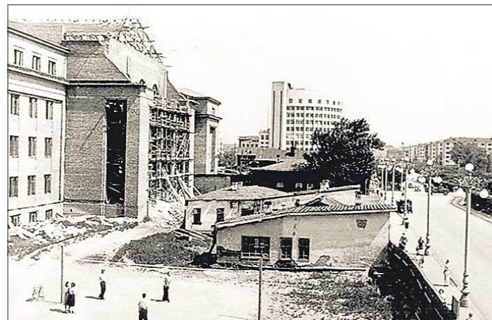
Пятидесятые годы. Строительство университета. Кстати, советская неоклассика отличается массивностью входной группы — поэтому сооружению именно этой части уделялось особое внимание

А привычного всем здания на проспекте Ленина в это время ещё не было... На этом ме-