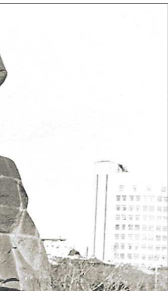
Памятник Свердлову был установлен в 1927-м — гораздо раньше университета. Обратите внимание — за ним ещё старая деревянная застройка