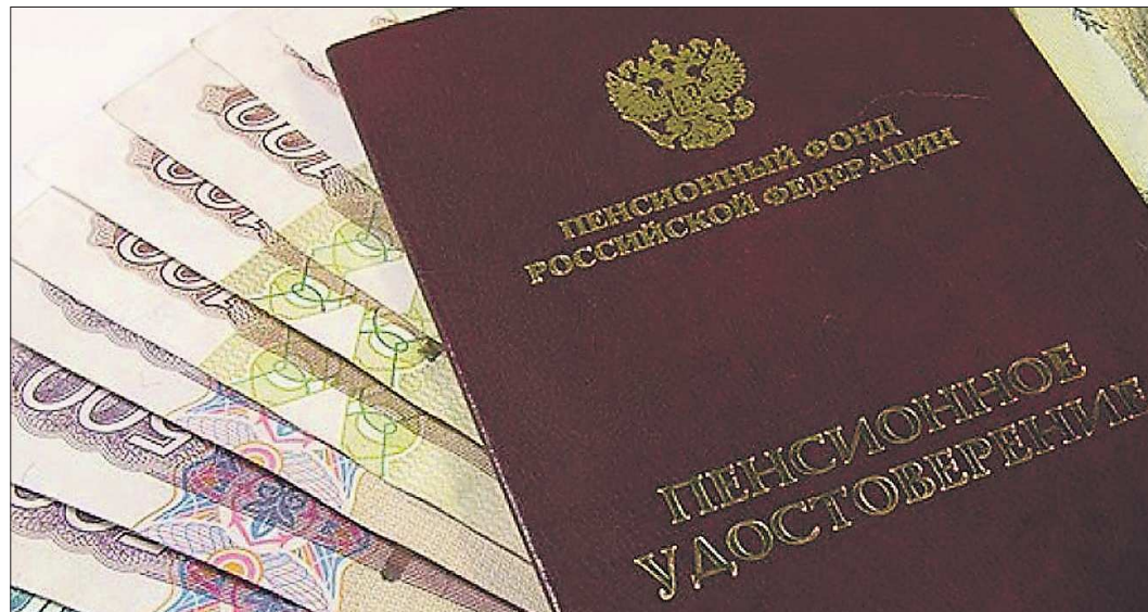
Чтобы этот год не оказался упущенным для софинансирования со стороны государства, необходимо до 31 декабря перечислить дополнительные страховые взносы в размере не менее двух тысяч рублей. Тогда государство удвоит эту сумму

Реквизиты Отделения Пенсионного фонда РФ по Свердловской области, образцы платёжных документов, а также бланки платёжных квитанций, необходимые для осуществления перечислений дополнительных страховых взносов, можно получить в территориальных управлениях ПФР либо на сайте Пенсионного фонда России www.pfrf.ru на страни-