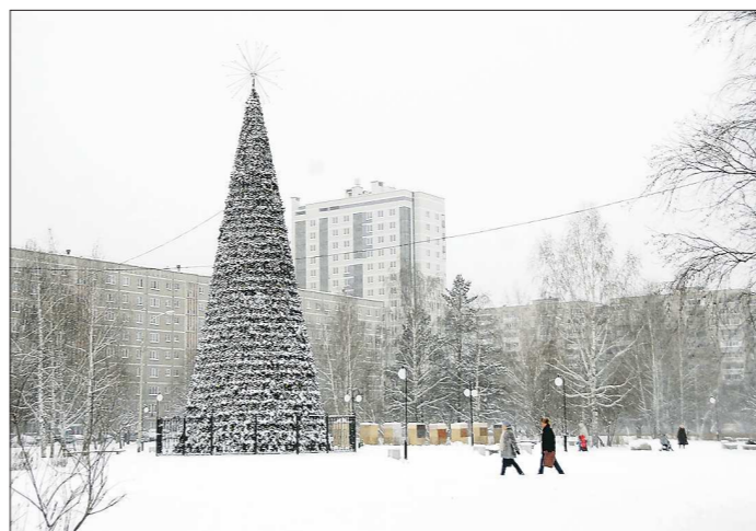
Эта ель видела то, что другим новогодним ёлкам и не снилось: тополиный пух, жара, июль... А сейчас 24-метровая вечнозеленая дождалась своего звездного часа — она уже украшена игрушками и гирляндами

В 2008 году всё-таки думали, что рано или поздно придётся елку убрать. Но когда подошло лето, а денег так и не нашли, решили оставить насовсем. Боялись только за хвою — может выгореть под ярким солнцем.