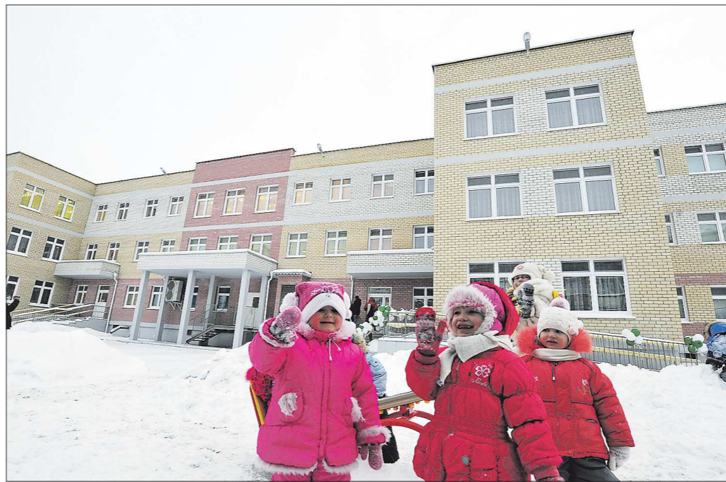
Маленькие «жители» нового «Теремка» в Асбесте с энтузиазмом осваивают участки для прогулок, общая площадь которых превышает 8,6 тысяч квадратных метров.

Однако для ребятишек главное всего, чтобы от воспитателей и персонала ис-