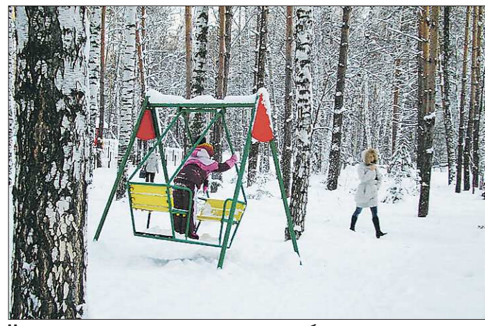
Новые качели в невьянских деревьях побудили местных старост подлатать и старые площадки