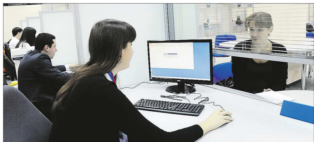
За 11 месяцев 2013 года консультации в многофункциональных центрах Свердловской области получили более 107 тысяч уральцев

В этом году в Свердловской области шесть тысяч детей получат возможность пойти в детские сады. Это столько же, сколько мест было введено в детских садах в предыдущие два года.