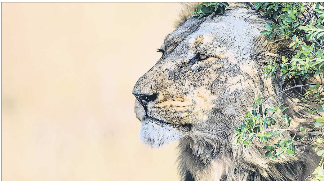
Этот кадр фотограф назвал «Мудрый взгляд». Лев спрятался в ветвях дерева, чтобы немного отдохнуть от беспокойного потомства, но при этом не переставал за ними внимательно наблюдать

Проект «Золотая черепаха» стартовал в 2006 году и на данный момент считается одним из самых престижных международных конкурсов фотографии. Что особенно приятно, учитывая, что создан он в России.