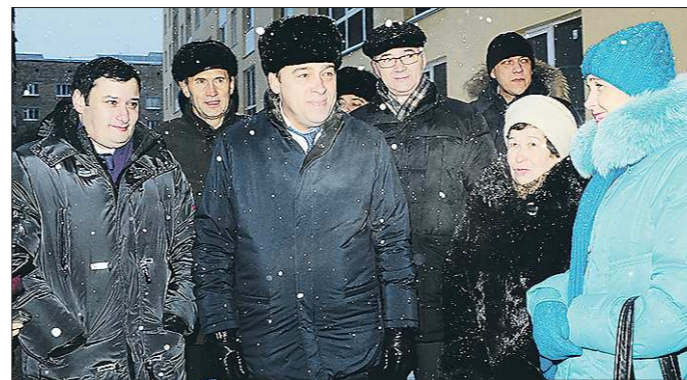
Свердловский губернатор Евгений Куйвашев (в центре) и депутат Госдумы Александр Хинштейн (слева) посетили шесть из двенадцати проблемных новостроек Екатеринбурга

— Сегодня у нас знаменательное событие — дольщики получают свои законные квартиры, — подчеркнул губернатор Свердловской области Евгений Куйвашев на торжественной церемонии. — Это значит, что в нашем регионе на один проблемный дом стало меньше, а у 230 дольщиков появился повод для праздника. У этой новостройки долгая история.