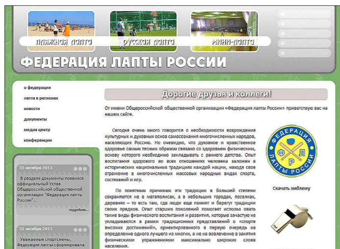
Это — один из ответов на вопрос, почему в лапте такая неразбериха. Каждая федерация делает вид, что конкурента не существует

ла оказались очень запутанными: — Играем-играем, вдруг загвоздка — и бежим книжки читать, сложные моменты разбирать.