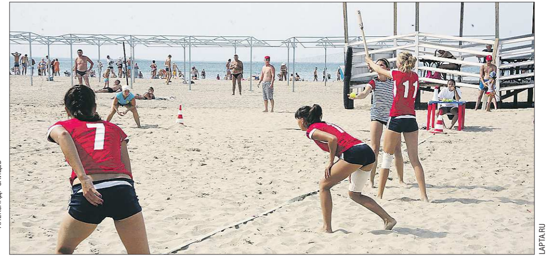
Как и у некоторых других видов спорта, у лапты есть пляжный вариант