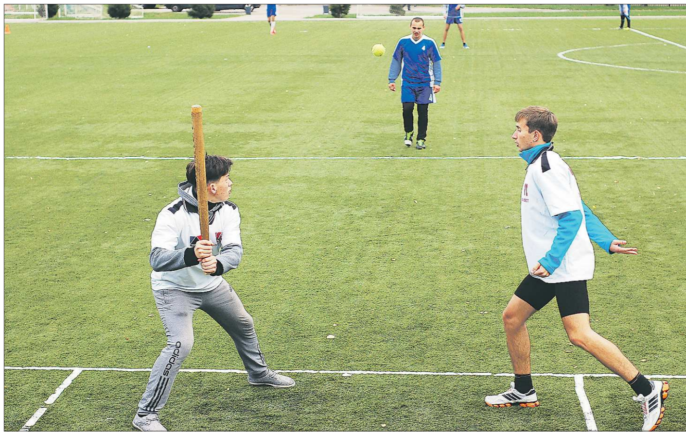
После удара нужно сразу как можно быстрее бежать. Пока мяч летит — соперник находится «без оружия», и эти секунды — золотое время для разыгрывающей команды