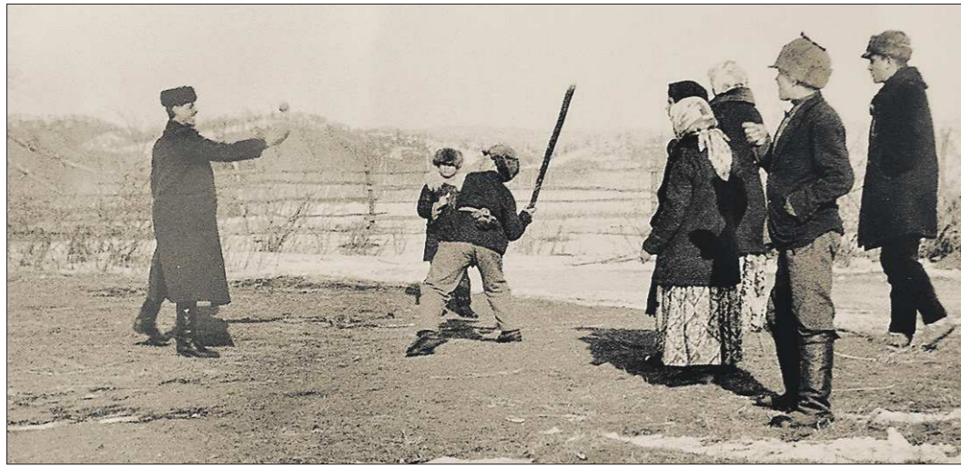
Лапту очень ценили старообрядцы. Снимок тридцатых годов XX века