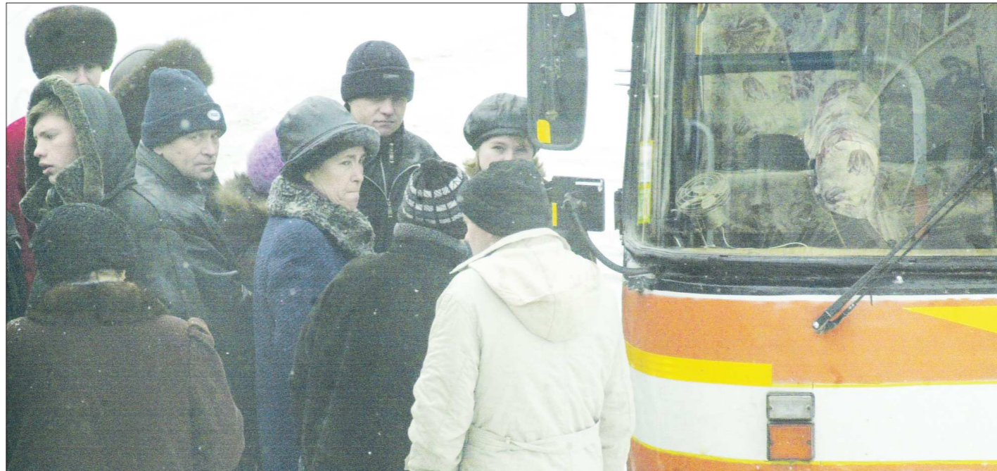
Для сотен уральцев, которые ежедневно приезжают в Екатеринбург, очень важна возможность выйти из межмуниципального автобуса, не доезжая до автовокзала