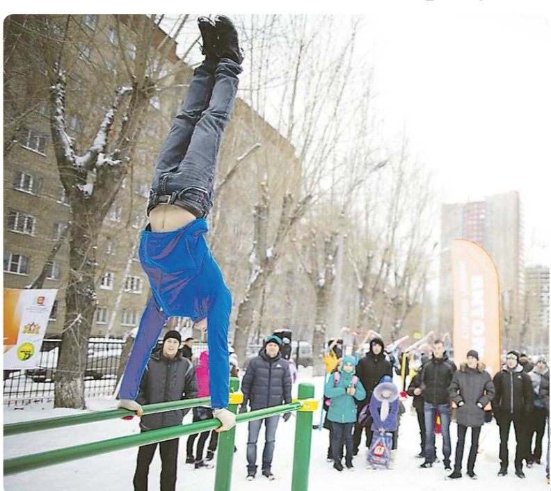
Посмотреть на трюки, исполненные спортсменами на новой воркаут-площадке, пожелало много жителей соседних домов

Во дворе екатеринбургской школы №7 появилась площадка для занятий воркаутом – это спортивный комплекс, который включает в себя турники, брусья и шведские стенки. Площадка стала третьей в Екатеринбурге и восьмой в Свердловской области. Посещать её могут все желающие.