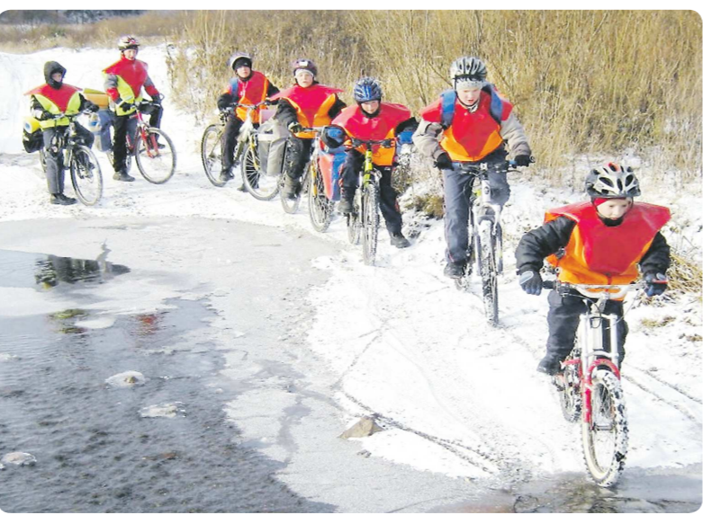
Снег и наледь не помеха для турпохода. Со своими велосипедами туристы не расстаются в любое время года

У «Новой эры» есть своя группа на сайте «ВКонтакте»