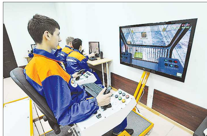
На подготовку современного рабочего нужны сотни тысяч рублей

В общем, рог изобилия из социального контракта на подсобное хозяйство пока не вышло. Во всяком случае, из-за черты бедности практически никому из участников эксперимента вырваться так и не удалось. Да, какое-то подспорье на какое-то время эти люди всё же получили. Удался ли это при более широком масштабе? А таких контрактов потенциально может быть 1719 — именно столько в области многодетных семей и одиноко проживающих граждан, которые имеют право на такую поддержку.