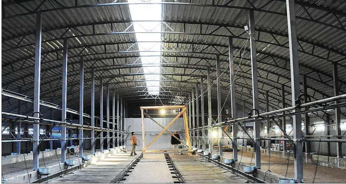
Не было бы счастья, да несчастье помогло. Эту поговорку наверняка не раз вспоминали шумихинцы, глядя, как растёт их стройка

Шумихинские коровки не торопливо жуют пахнущий клевером обед и не подозревают, что через пару недель их жизнь кардинально изменится.