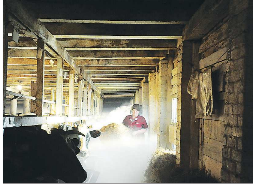
Скоро с этого старого и тесного двора коров переведут на новую ферму

Дело было так. В совхозе «Шумихинский», который по праву считался опорой сельскохозяйственного производства в Горнозаводском управленческом округе, в 2009 году по невыясненным обстоятельствам среди бела дня стореда ферма.