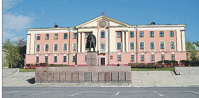
Думу Новоуральска не устраивает схема власти «о двух головах»

Однако есть в административной галерее и «весёлые картинки», на них в еженедельном формате отражается, как обстоят дела с реконструкцией четырёх и строительством одного детского сада в городе. Эти объекты новый глава взял под свой личный контроль. Если там возникнут какие-то проблемы, общественность сразу увидит их на фото. Такая вот стена сдачи экзамена на профпригодность получается.