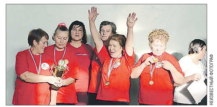
Победители соревнований — команда «Щелкунчик»