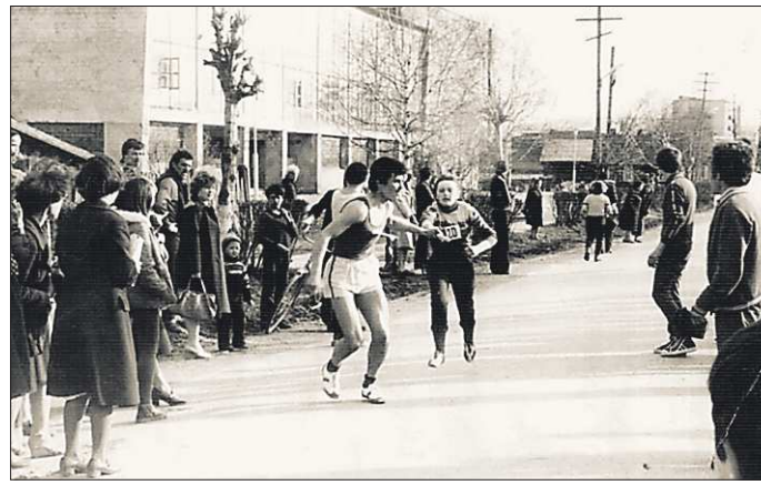
Со дня своего открытия «Синегорец» был центром спортивной жизни посёлка

Между тем «Синегорец» — центр спортивной жизни посёлка с 11-тысячным населением. Здесь работает более двадцати секций. Местные мастера русского хоккея, лыжники и атлеты — настоящие звёзды. Были когда-то здесь и сильные пловцы, но уже двадцать лет бассейн в спорткомплексе не работает. Плавать негде. В плачевном состоянии и другие помещения. Здание, хоть и не старое, требует капитально-