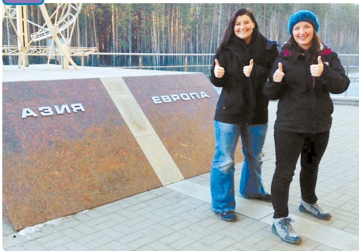
Девушки ещё никогда не были и в Европе, и в Азии одновременно

На улице Вайнера англичанок удивил памятник Гене Букину. Они так и не поверили, что это всего лишь ленивый продавец обуви из сериала