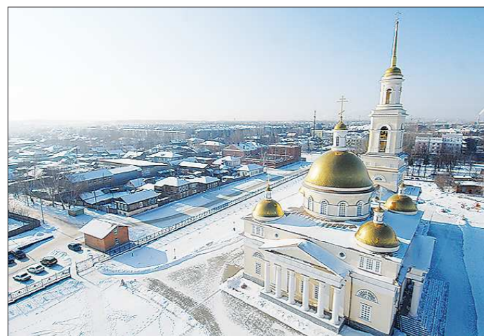
Иностранцам гостям, как и нашим соотечественникам, Невьянск предстаёт городом, чья история окутана тайнами и легендами

— Проект «Самоцветное кольцо Урала» основан на частно-государственном партнёрстве и демонстрирует желание со стороны бизнеса вкладывать средства в развитие интересного маршрута. Правительство Свердловской области выделяет деньги для создания базовой инфраструктуры, — подчеркнул Максим Пузанков. Он отметил, что региональное министерство финансов заложило в бюджет приличную сумму на поддержку музеев, которые находятся на маршруте.