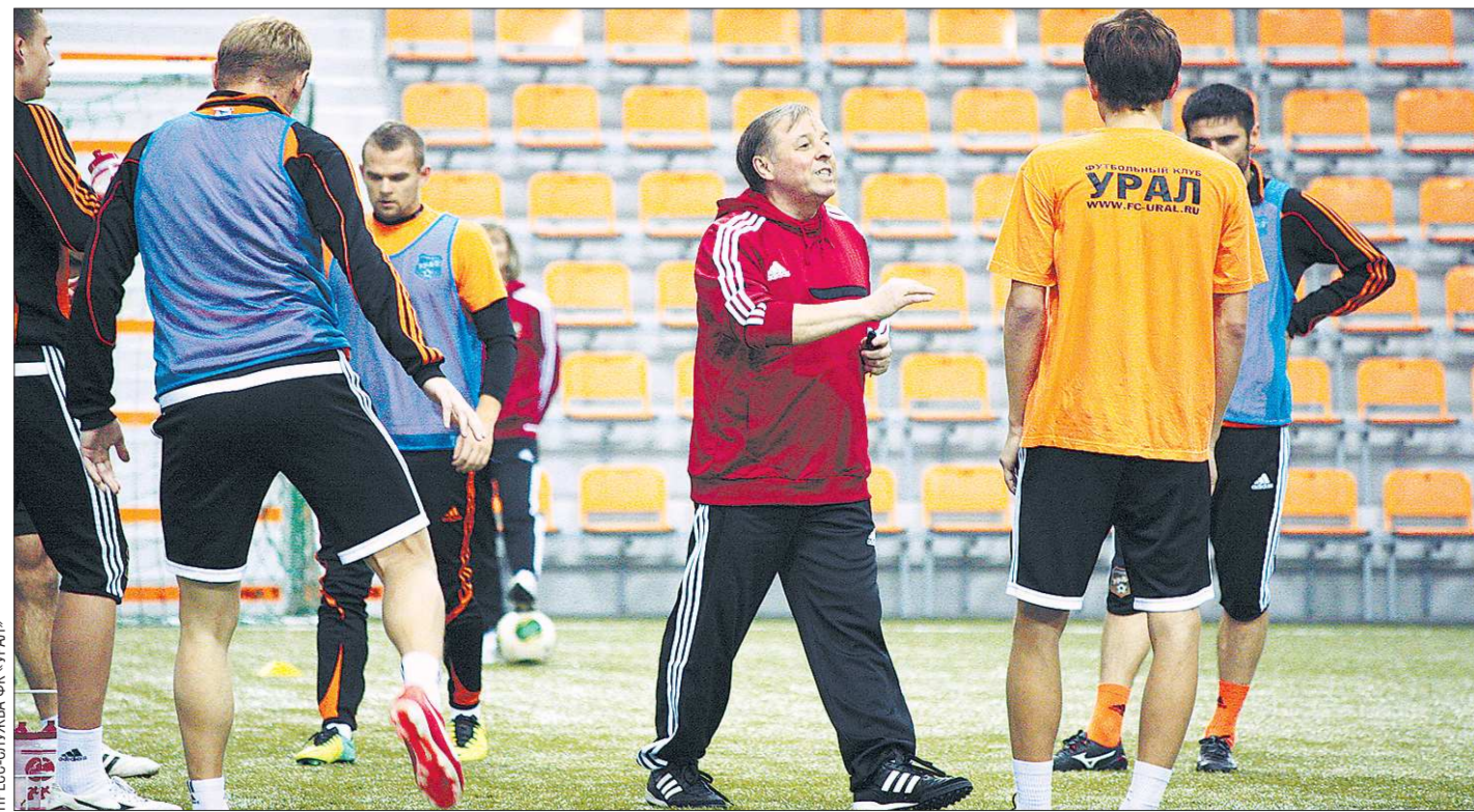
Новый тренер видит свою основную задачу в том, чтобы раскрепостить футболистов